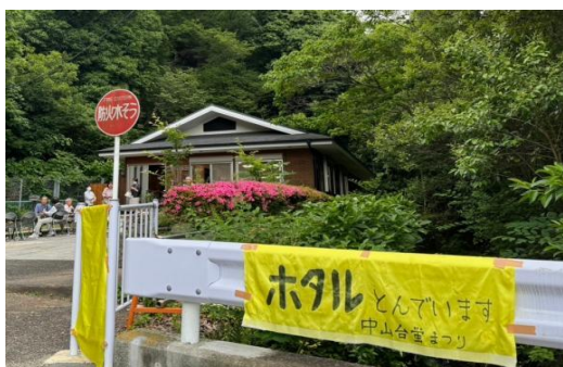
ほっこりハウスを見守る

ことしも中山台自治会が6月6日（土）19時頃から、このほっこりハウスでホタル鑑賞する「ホタルのタベ」を開催し、200人ほどの子供や住民たちが訪れました。また近隣の高齢者福祉施設「中山ちどり」に居住されているお年寄りも招待されました。みなさん手のひらに止ったホタルに、「わー、きれい！」と、歓声をあげていました。