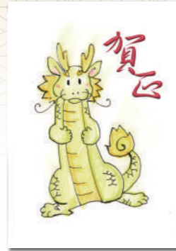
丸橋小地区委員会