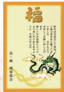
花・緑・環境部会