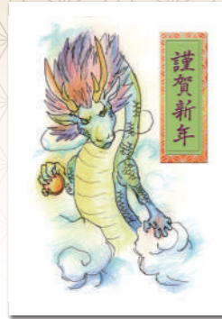
長尾南小地区委員会