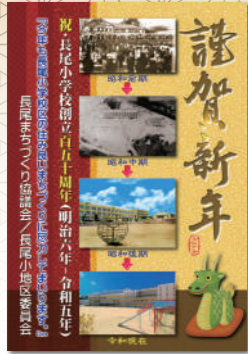
長尾小地区委員会