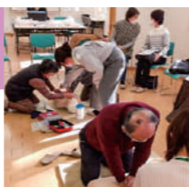
心臓マッサージは力がいらいます。なかなか大変。▲

この研修は「いざという時AEDはどこにあるの?」「AED設置場所の地図はあるの?」という声を受けて行うことになりました。救急隊の方から「AEDや救急車が到着するまでの心肺蘇生が重要」という説明を受け、心肺蘇生法も行いました。「人工呼吸よりも心臓マッサージをずっと続けることの方が大事」など以前聞いたことと違う点もあり、最新の情報を知ることができました。また部会で第5地区内にあるAED設置場所の地図を作成し、参加者で確認しました。(地図はふれあいひろばにあります。)最後に救急隊の方より「一人でも多くの命を救うため、みなさんは非3時間の救命講習を受けてください」とのことでした。詳しくは消防署にお問合せください。