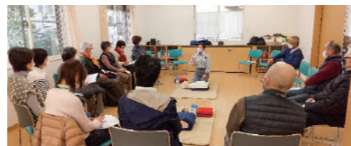
▲ みなさん熱心に受講