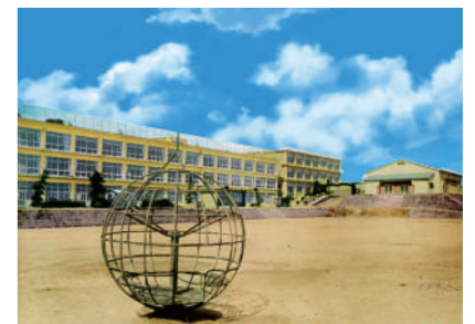
昭和40年代当時の校舎

宝塚市立長尾小学校は令和5年(2023年)創立150周年を迎えます。明治6年(1873年)山本小学校として設立。その後、明治12年(1879年)長尾小学校に改称、そして昭和30年(1955年)長尾村が宝塚市に編入し「宝塚市立長尾小学校」となります。現在の場所には、昭和34年(1959年)に移転しました。元は今の山本南1丁目の天神川沿いにありました。戦後、住宅開発が急激に進み、人口増加に伴い児童数も急増し、長尾小学校以外に長尾南小、丸橋小、中山桜台小、長尾台小、中山五月台小、安倉北小、山手台小と開校しましたが、今も市内では最大の児童数を有する超大規模小学校です。長尾小学校には、今の伊丹市北部を含む広範囲に多くの卒業生がおられます。150年の長きにわたる歴史ある小学校として在校生を含め、これからも未来に輝く夢と希望を持った子どもが育つ小学校であることを望みます。