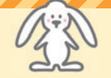
宝塚市のまちづくり協議会の 公式マスコットキャラクター まちキョン

宝塚市には、おおむね小学校区ごとに20のまちづくり協議会(まち協)があります。 地域の中の様々な個人や団体がつながり、地域の特性を生かして、自分たちのまちを良くする 組織がまちづくり協議会です。