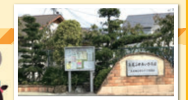
長尾地区まちづくり協議会の活動拠点 【長尾ふれあいひろば】