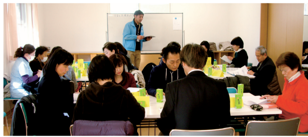
子育て支援ネットワーク会議

1月24日には保育所・園、幼稚園、各子育てグループ、民生児童委員の代表と専門職の24名で寄せられた回答・意見について「子育て支援ネットワーク会議」を開催しました。