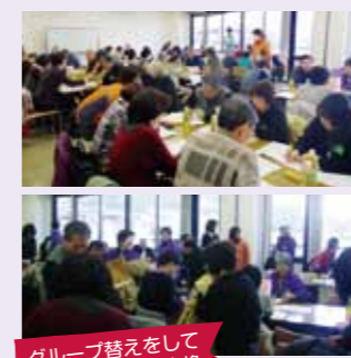
グループ替えをして多くの方と情報交換

当日は民生児童委員協議会やまちづくり協議会からも参加があり、自治会の事を知り、いろいろな立場から自治会について一緒に考える有意義な時間になりました。今後の課題も見つけられ継続の希望も多くありましたので、皆様も次回ぜひ参加してください。