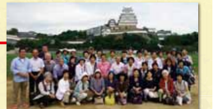
20周年記念1日研修(姫路市)