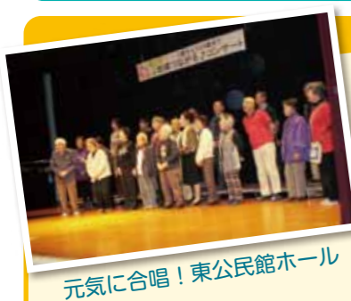
元気に合唱! 東公民館ホール