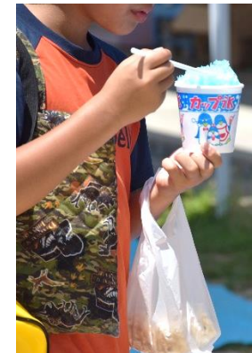
暑い日にはやっぱりコレ