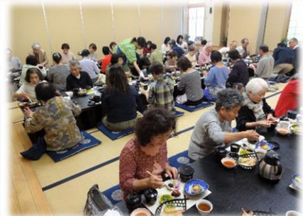
美味しいランチに舌鼓