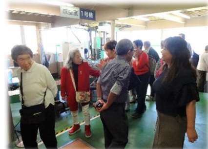
お香作りにも挑戦しました