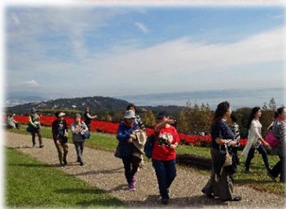
サルビアが見ごろでとてもきれい

「あわじ花さじき」で、大阪湾を背景に、天空一杯に広がる、見ごろのサルビアとコスモスを鑑賞。「きとら津名店」で海鮮ランチを頂き、「たこせんべいの里」「産直淡路島赤い屋根」などで、淡路島の名産を両手に一杯お買い物。「薫寿堂」で伝統のお香づくりを見学、体験教室でお香を手づくりし、作品をお持ち帰り。車中ではガイドさんの名調子や脳トレのゲームを楽しみ、秋の一日を満喫しました。