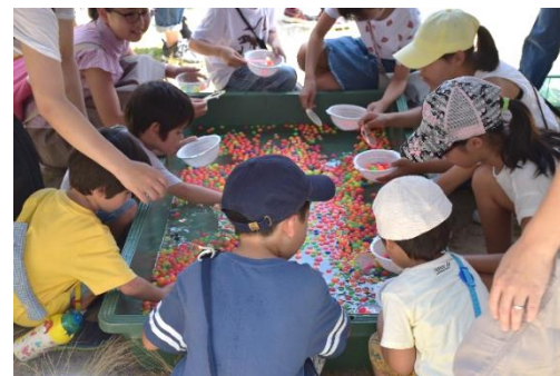
スーパーボールすくい毎回大人気です