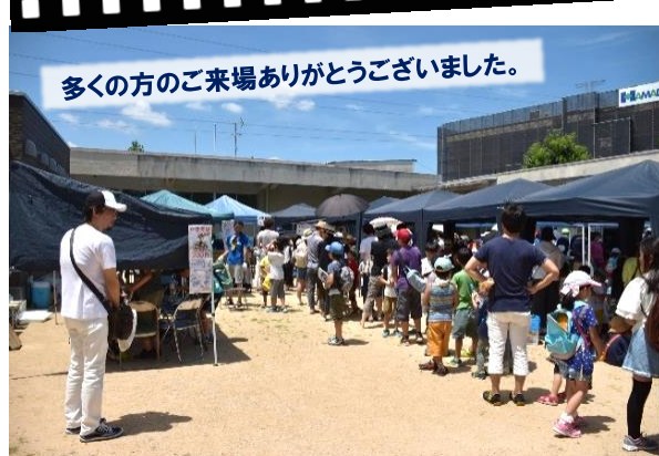
多くの方のご来場ありがとうございました。