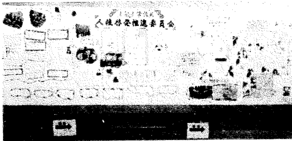
小浜小学校区人権啓発推進委員会

展示物に加え、ヨーガ体験、オリジナルキーホルダーを作ろう、絵本の読み聞かせ、手作りマスク制作なども実施されました。手作りマスク制作の多目的室には、たくさんの人が来られ、密にならないように順番に手ほどきを受けていました。