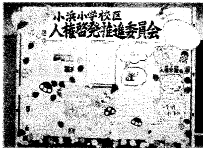
人権啓発推進委員会