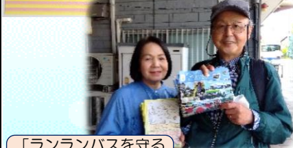
「ランランバスを守る会」から乗車記念品を頂きました。