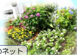
花と緑のネットワーク 花壇