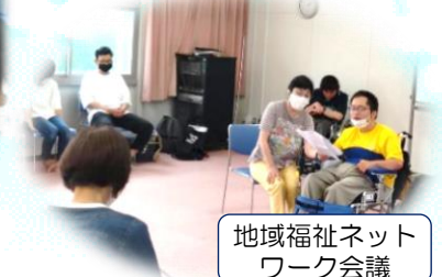
地域福祉ネットワーク会議

みなさまにぜひご参加いただき、まずは顔の見える関係づくりから地域のつながりの場をもちたいと思っています。