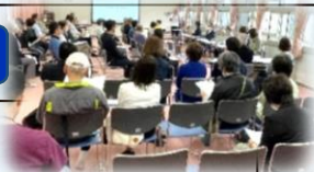
総会に出席のみなさん