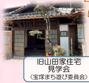
旧山田家住宅 見学会 〈宝塚まち遊び委員会〉