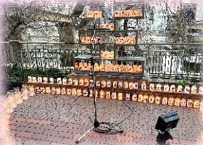
「生」の祈り 震災慰霊行事