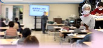
小中高生ボランティアクラブ 防災教室