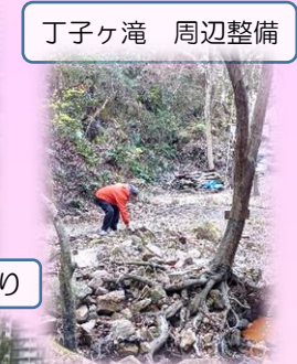
丁字ヶ滝 周辺整備