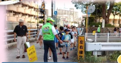
通学見守りボランティア