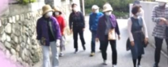
ふれあいサロン桜のつぼみ ↑お散歩クラブ 防災教室↓→