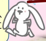
一小宝梅ハウス ふれあいカフェ 野菜市

昨年度策定した地域ごとのまちづくり計画に沿い、住み続けたいまちづくりへの協働の取り組みが活発に進められています。