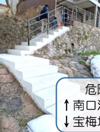
危険箇所改善 ↑南口河川敷階段改修 ↓宝梅坂ガードパイプ設置