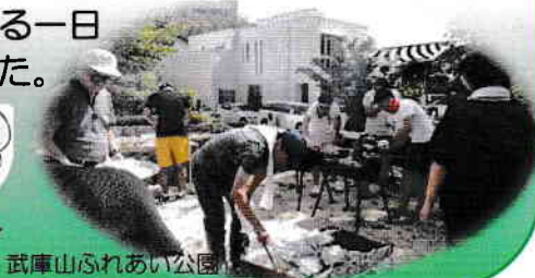
武庫山ふれあい公園

編集後記 Vol.36はいかがでしたか。広報委員全員の知恵を結集して、8,200世帯の皆様にお届けします。空や山の色合いや虫の鳴く声に深まりゆく秋の気配を感じる今日この頃です。(富樫 記)