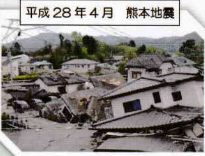
平成28年4月 熊本地震