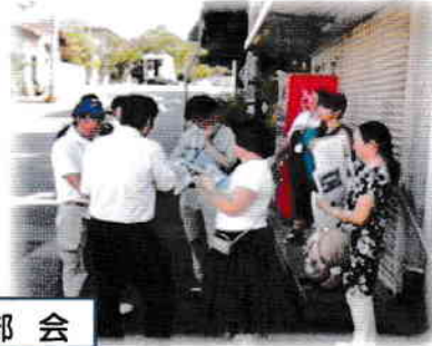
←行政担当者と危険箇所の現場確認

トラックによる死亡事故等交通事故が多発している現場です。一小育友会、宝塚中PTA、近隣自治会、一小、宝塚中、まちづくり協議会で検討を重ね、路面上の注意喚起とガードパイプなどの設置を要望しました。