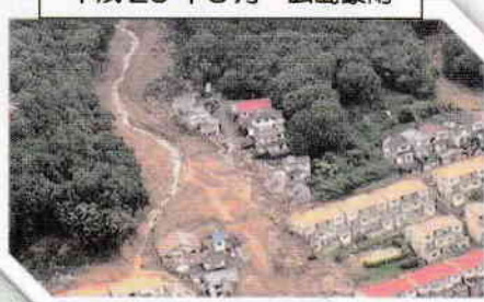
平成26年8月 広島豪雨