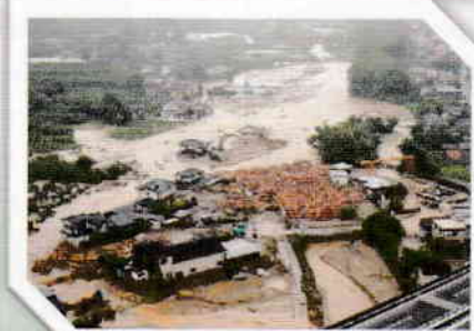
平成29年7月 九州北部豪雨

いつ起こるか 予測できない自然災害 身を守る方法は ご家庭の備え ご近所の支え と地域の防災訓練に 参加すること・・・