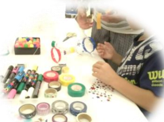
夏休み世代間交流広場