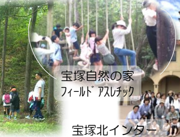
宝塚自然の家 フィールド アスチック