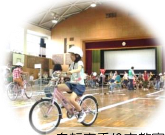
自転車乗り方教室

「きれいな花・きれいな環境」 今年度は、昨年の苔テラリウムに代えて、寄せ植え講習会の復活とお花の交換会を行う予定です。花壇グループの活動支援、年2回の支多々川清掃活動も継続して行います。