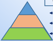
【まちづくり計画の構成】