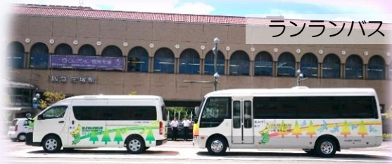
地域をつなぐ (お互いさまがあふれるまち)

VOL.40 2019年3月31日発行 編集・発行 広報委員会 連絡先 一小宝梅ハウス 0797-57-9060