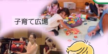
きらきら母交響楽団 コンサート