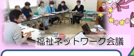
福祉ネットワーク会議