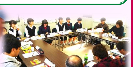
まちづくり計画 中学生との座談会