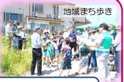
思いをはこぶ (安心・安全のまち)