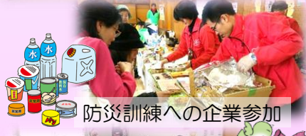
防災訓練への企業参加