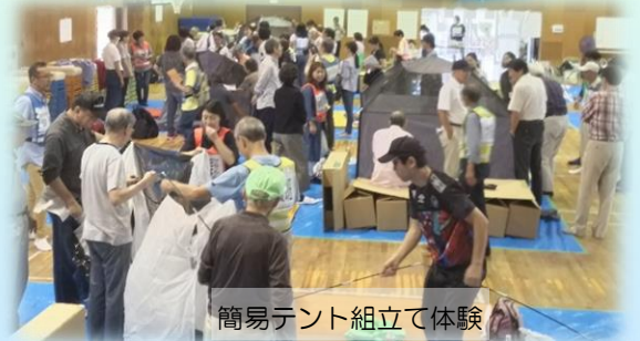
簡易テント組立て体験