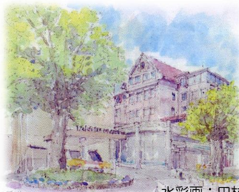
水彩画：田村博美氏