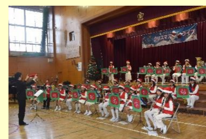
宝塚小学校少年少女音楽隊