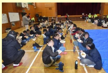
炊き出し訓練でカレーを食べる4年生