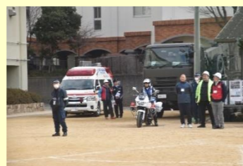
警察、消防、自衛隊の車両が揃う