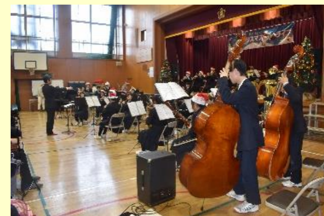
御殿山中学校 吹奏楽部

12月15日にクリスマスライブを開催しました。最初の演奏は御殿山中学校琴部の皆さん。公立の中学校では珍しい琴部ですが、日本の曲からクリスマスソングまで素晴らしい演奏でした。次はすっかりおなじみになりました「フィオーナープアハラアロハ」によるフラダンス。続いたの「宝塚小学校少年少女音楽隊」は息の合った素晴らしい演奏でした。途中の休憩を兼ねた時間帯でピンゴゲーム大会を行い大変な盛り上がりでした。後半は御殿山中学校の「吹奏楽部」と「コーラス部」の皆さんで、いつもながら大変素晴らしい演奏でした。引き続き「fumfum アンサンブル」の演奏。宝小地区に在住のプロの演奏家によるヴァイオリン、フルート、トロンボーンの演奏でした。そして今年のフィナーレを飾って頂いたのは、宝塚北高等学校演劇科の素晴らしく活力を感じるダンスでした。