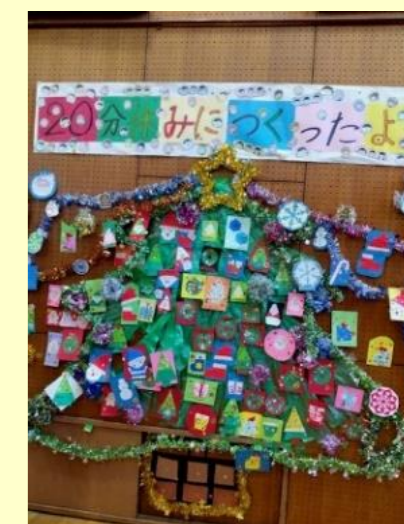
20分休みに1年生から6年生までが自由参加で作成「楽しみました」（福祉活動部）