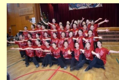
宝塚北高等学校 演劇科