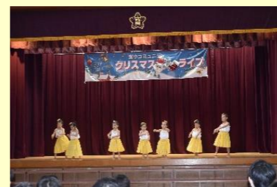
フィオーナープアハラアロハ