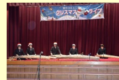
御殿山中学校 琴部