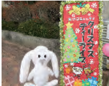
まちづくり協議会キャラクター「まちキョン」

宝小コミュニティの恒例行事のひとつになった第4回クリスマスティーライブが宝塚小学校体育館にて行われました。