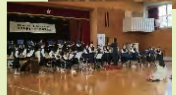
子どもたちの発表会 (御殿山中にて)