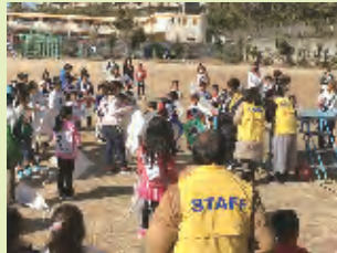
凧あげ大会 (すみれ小にて)