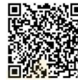
学校応援団登録申込