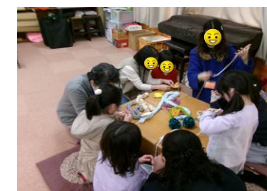
▲昔あそび体験(指編み)

今年度からスタートしたこの活動は、お陰様で前述(コミュニティの今年度活動報告)のように順調に進んでいます。皆様のご協力に心から感謝いたします。今後とも多くの皆様に、無理なく継続可能な私たちでのボランティア登録をお願いします(登録申込はこのQRコードをご利用ください)。