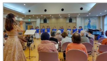
▲ふれあいコンサート

11月17日ふれあいコンサートを栄光園で開催しました。音楽は、エネルギーをハーモニーにして、世の中の時の出来事を心と共にします。音楽は、ルーツを国際で歌い活動します。コンサートは、コミュニティの大切な活動です。