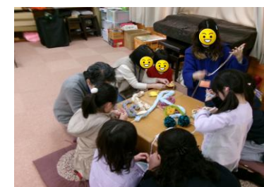
▲昔あそび体験(指編み)

今年度からスタートしたこの活動は、お陰様で前述(コミュニティの今年度活動報告)のように順調に進んでいます。皆様のご協力に心から感謝いたします。今後とも多くの皆様に、無理なく継続可能なかたちでのボランティア登録をお願いします(登録申込はこのQRコードをご利用ください)。