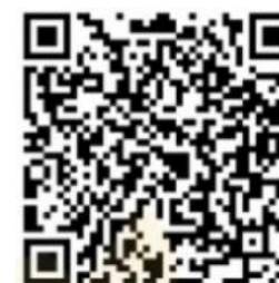
学校応援団登録申込