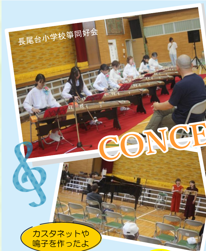
長尾台小学校箏同好会