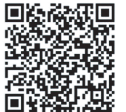
コミュニティひばりブログ

https://takarazuka-community.jp/wp-content/uploads/sites/21/2020/08/02fb58737b0617d2f335ea3fcf260653.pdf