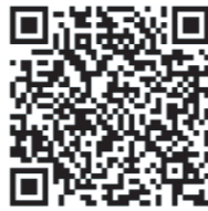
回答用 QR コード

問合せ先 メール cohibari@outlook.jp 又は FAX 072-744-2526