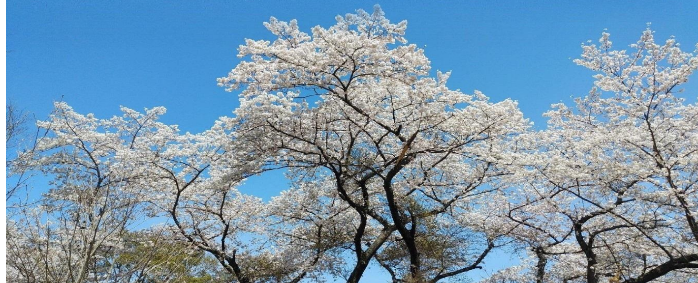
表紙写真 北雲雀きずきの森の桜(ソメイヨシノ)

1/1 元旦、突然能登半島地震のニュースが入ってきました。 土砂崩れ、家の倒壊、道路、水道、電気の寸断等、 29年前の阪神・淡路大震災の事が思い出されます。 1日も早い復興を願っています。