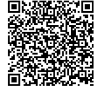
家庭でできる 災害への備え