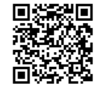
災害用伝言ダイヤル

発災すると電話はつながりにくくなります。 録音 1→電話番号→録音する 再生 2→電話番号→再生する ※毎月1日と15日に体験利用ができます。 詳しくは右のQRコードからHPをご覧ください