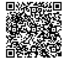
宝塚市防災マップ