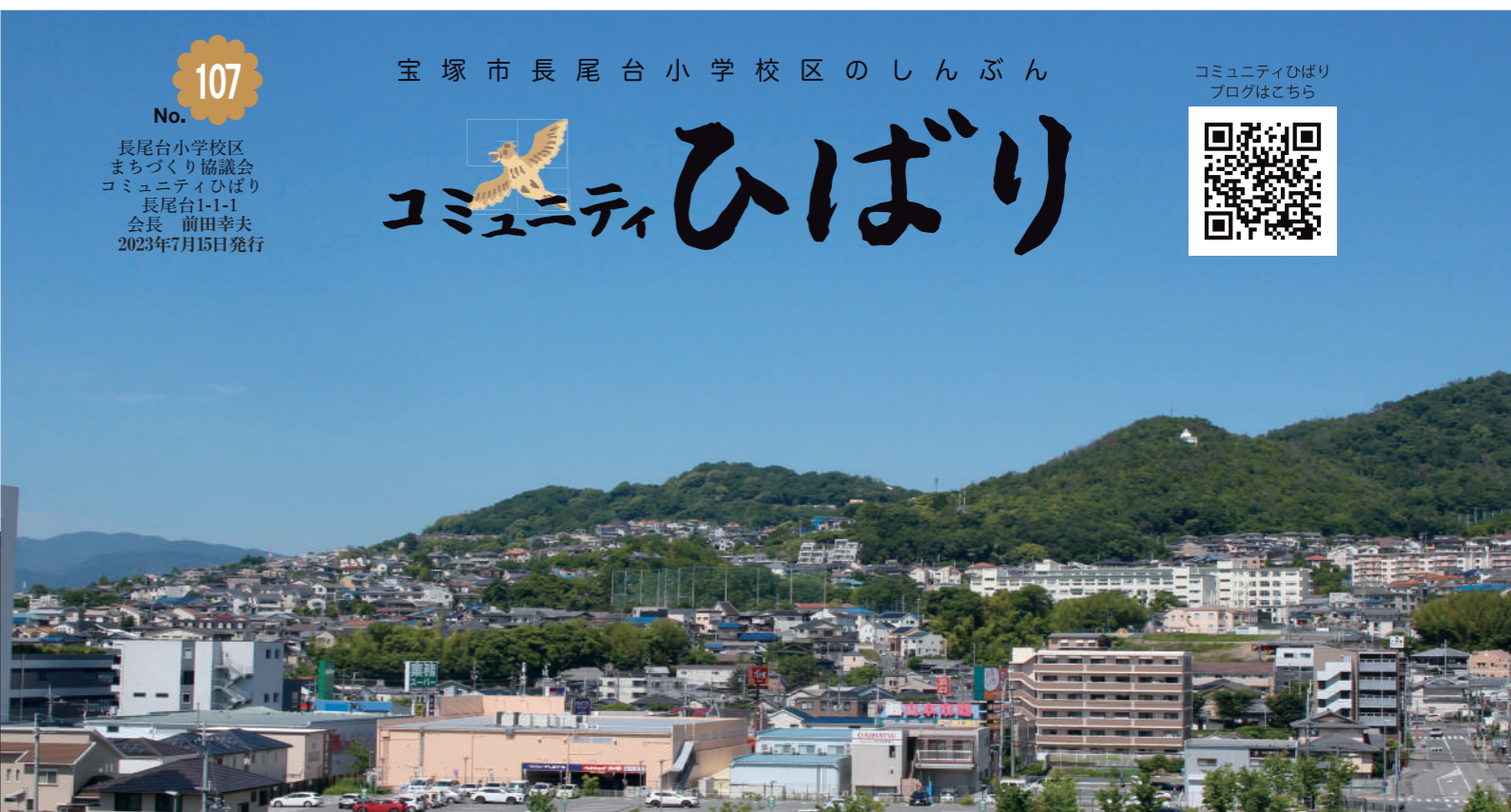
▲能勢口付近から校区を見る