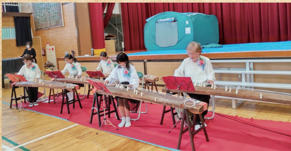
長尾台小学校箏同好会の演奏

長尾台小学校体育館にてひばり祭りが行われました。バザーやカフェ、地域対抗スローイングビンゴ大会、音楽会、防災訓練（防災用品展示、防災食試食）と盛りだくさんの内容でした。スローイングビンゴ大会のトーナメント戦を勝ち抜いたのはA面コートがふじが丘、B面が満願寺町の各チームでした。