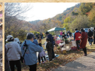
掘り出し物がいっぱいのフリマ