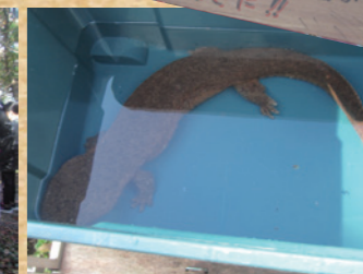
交雑種オオサンショウウオの展示