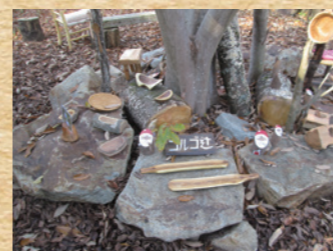
グリーンウッドワーク・木工作品の展示とクイズ