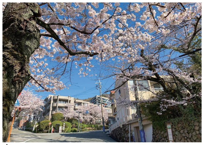
フォトコンテストグランプリ「桜の咲くころ」soramilkさん