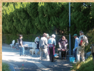
コミセン前で焼き芋配布