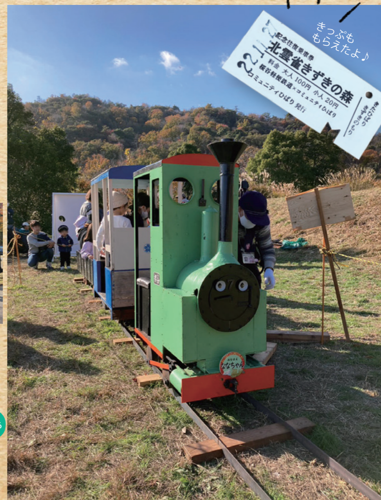
みはらし広場を走る桜谷軽便鉄道