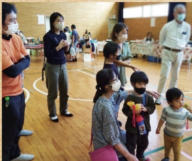
予想以上に白熱しました！スローイングビンゴ大会