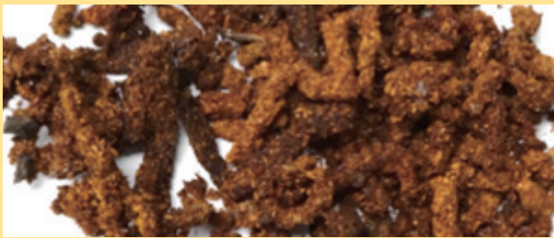
クビアカツヤカミキリのフラス