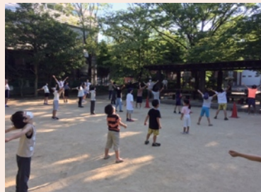
眠気もふっとぶ！夏休みラジオ体操

コロナ禍でイベントはしばらく中止していましたが、11月27日には秋祭りを無事に開催できました。また、今年の夏には砂場に日よけのテントを立て屋根の下2カ所にミストシャワーを設置しました。気持ちよく公園を利用できるよう工夫を凝らしています。