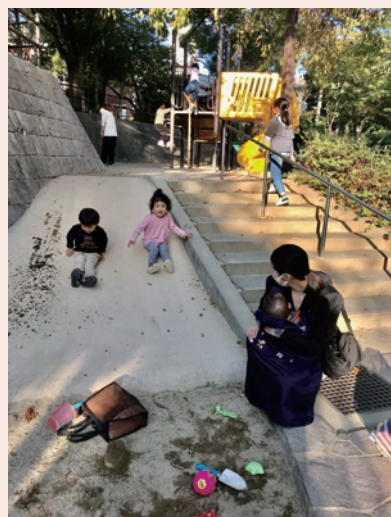
休日や学校終わりは子どもがいっぱい

雲雀丘山手公園はたくさんのお木々に囲まれた自然豊かな公園です。眺望がすばらしく、大阪平野が一望できます。ベンチが各所にあり、お散歩やウォーキングの休憩スポットにもなっています。グラウンドではグラウンドゴルフやボール遊びも出来、滑り台付きの遊具や砂場は小さな子どもたちに人気で、誰もが楽しめる憩いの場所となっています。