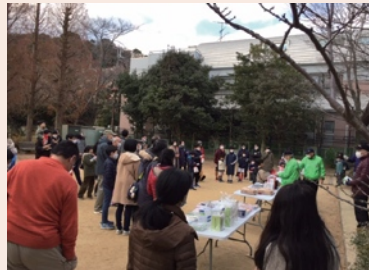
何が当たるかな？！クリスマス抽選会