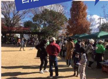
今年は秋祭りを開催しました