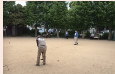
60歳以上の人たちが集うひばり会ではゲートボールなど身体を動かしたり、楽しい催しを行っています。メンバー募集中。