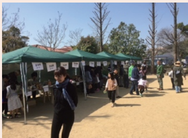
桜祭りのフリーマーケット