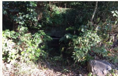
切畑群集墳雲雀丘C北支群1号墳