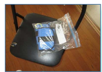
▲いきいき百歳体操で使用する用具は共有せず一人ずつ袋に入れ、持ち主それぞれが管理しています。(写真は花屋敷荘園いきいき百歳体操の用具)