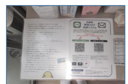
▲ひばり子ども館や花屋敷荘園自治会館、つつじが丘集会所などは「兵庫県コロナ追跡システム」を登録しています。施設利用時にバーコードを読み込むと、後日、陽性者の利用が判明した場合に県からの注意喚起情報を受信できます。