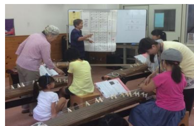
長尾台小学校箏同好会の皆さんによる、4年生箏体験学習

コミュニティスクールは、学校・保護者・地域が学校教育のビジョンや課題を共有し、一体となって学校運営を進めていく仕組みです。そのためには、学校運営協議会を開催すると共に、学校を支援していただく体制づくりが大切になってきます。具体的には、地域の皆様に子どもたちの学習の充実や安全のため、学習の講師や技術サポート、支援ボランティアなど様々な形で学校教育に参加していただきたいと思っています。