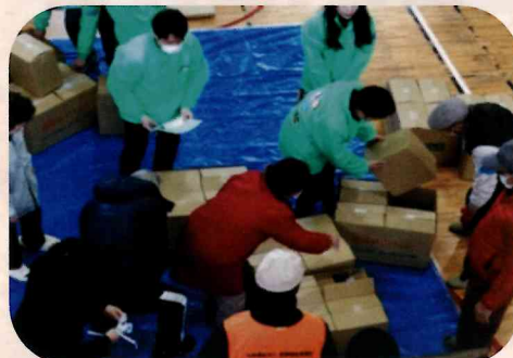
簡易ベッドの組み立て