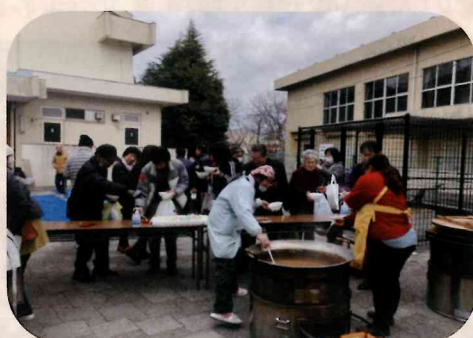
アルファーマ米を使って カレーの炊き出し