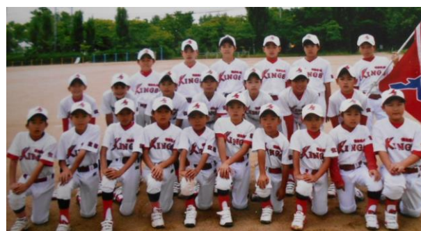
宝塚市スポーツ少年団 安倉里の坊キングス

全国制覇という大きな目標を掲げ頑張る子ども達を安倉小学校のグラウンドに来て応援して頂きたいと願います。